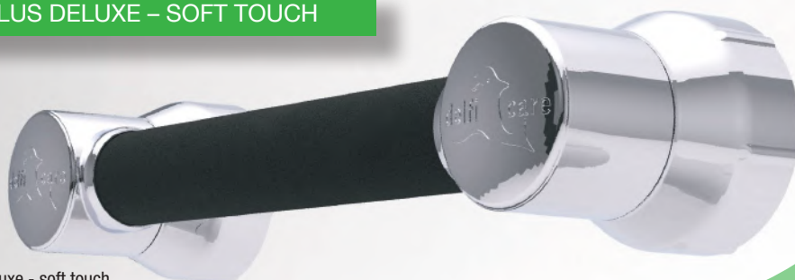
varioplus deluxe - soft touch Trägerfarbe chrom, Grifffarbe schwarz 30cm/50cm · Art.-Nr. Seite 21